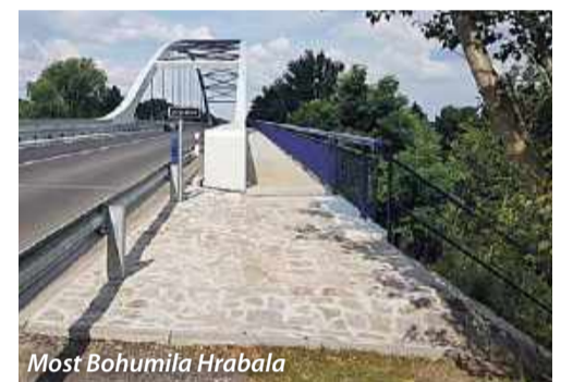
Most Bohumila Hrabala

Přes most Bohumila Hrabala vedou dvě turistické trasy (na portále mapy.cz jsou již na popud Klubu českých turistů zrušeny), naučná stezka, most využívají místní, děti jedoucí na veslák či stovky cyklistů. Jak tuto situaci řešit co nejrychleji? Nejjednodušším řešením by bylo vybudovat úniková schodiště po obou stranách mostu tak, aby cyklista či pěší nemusel přecházet silnici. Vedení města však žádné požadavky na řešení této situace nezadalo. Přitom stačilo aktivně se zapojit do projektu a připomínkovat problematické části!