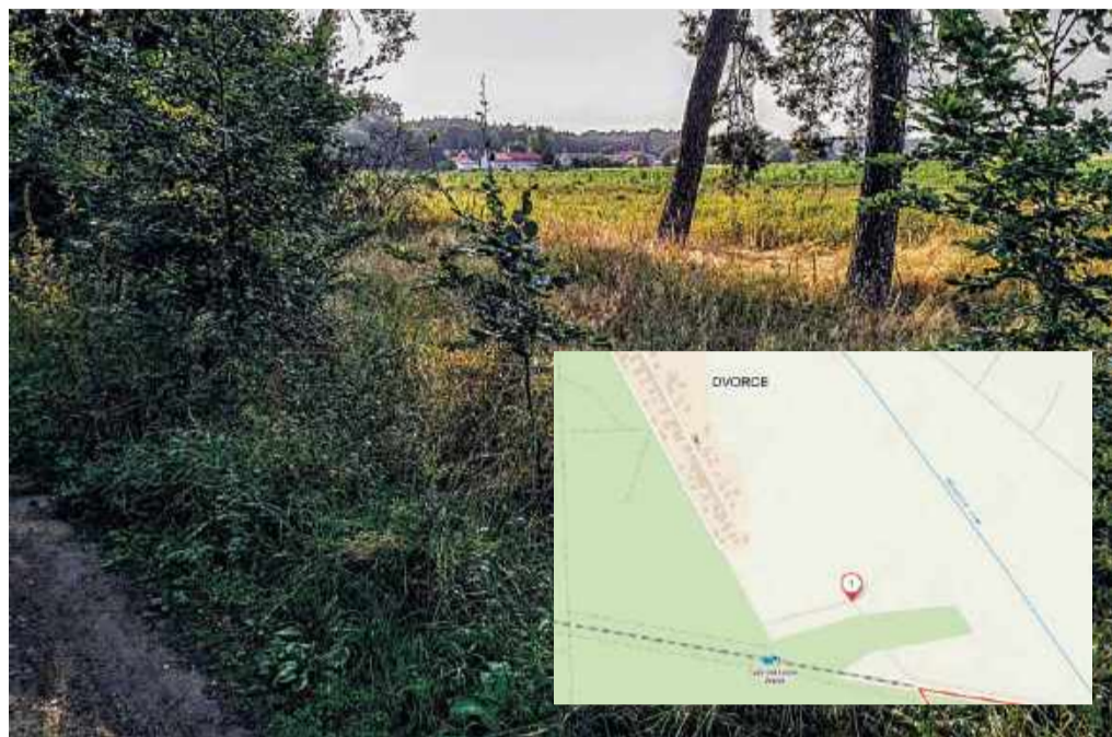
Místo někdejšího internačního tábora u Dvorců (poloha tábora vyznačená na mapě)

Samotné počátky internačního tábora popisuje protokol z července 1946, sepsaný u Místního národního výboru v Lysé, který rekapituluje historii tábora: „Tábor byl zahájen dne 21. května 1945 tím, že pražské policejní ředitelství poslalo do Lysé n. L. vlak s německými ženami a dětmi, který dva jeho úředníci nechali v noci v Lysé n. L. na nádraží s tím, aby byl ráno předán MNV. Žádný písemný příkaz v té věci nebyl předán ani později nedošel. MNV ubytoval je v barákovém táboře, opatřil jejich hlídání a stravování. Ohledně vedení a hospodaření ve středisku nedošly žádná(!) instrukce od nadřazených úřadů, což se stalo asi až za tři měsíce.“ Internační tábor v Lysé totiž nebyl obvyklým internačním táborem, v němž měli být na základě prezidentského dekretu č. 16/1945 Sb. umístěni nacističtí zločinci, zrádci a kolaboranti. Stal se útočištěm Němců zadržovaných v Praze těsně po osvobození a posléze vyvezených z města. V tu dobu ještě neexistovaly žádné přesnější instrukce k vysídlování německých obyvatel z Československa. Tomu odpovídá i zcela atypické složení tábora. Podle hlášení z října 1945 se v Lysé nacházelo 329 žen, 199 dětí do 15 let a pouze dva muži (lékař a ošetřovatel).