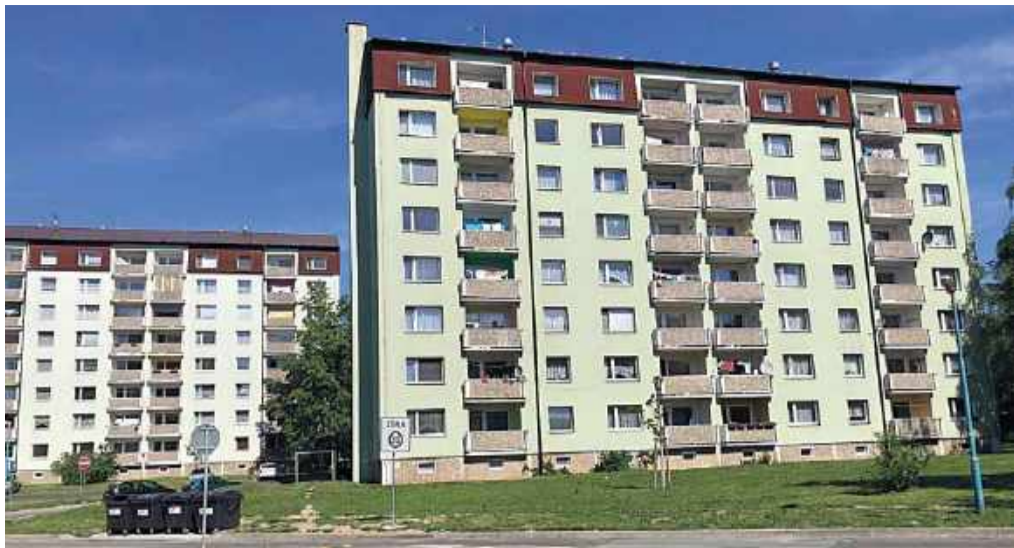
Bytové domy v Milovicích, které jsou ve vlastnictví města Lysá nad Labem