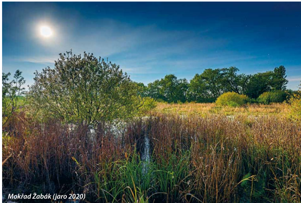
Mokřad Žabák (jaro 2020)

Před pár týdny začalo našim městem hýbat slovo „mokřad“. Teprve letos na jaře totiž širší veřejnost zjistila, že je takové nenápadné místo kousek od města za tratí na Milovice a vlevo od silnice na Stratov. Lidé mu začali říkat „Žabák“, a ačkoliv spousta z nich o něm ještě nedávno nevěděla, vrhli se do boje za jeho záchranu. Město se totiž rozhodlo pozemky mokřadu, o jehož existenci přinejmenším někteří zástupci koalice stále pochybují, a jeho okolí prodat za 1 Kč Středočeskému kraji. Kraj zde chtěl vystavět výcvikové a ukázkové centrum „Svět záchranářů“.