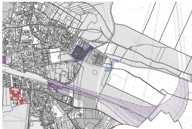
Návrh změny ÚP

Z předložených výkresů je zřejmý rozpor mezi rozsahem záboru zakresleného v situacích ZÚR a navrhované změny ÚP. Tento stav nemá zákonný podklad a zpracovatel touto úpravou překročil své zmocnění dané mu zákonem i pověřením zastupitelstva.