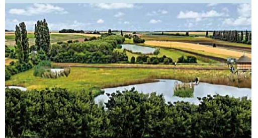
VIZUALIZACE MOŽNÉHO VYUŽITÍ MOKŘADU ŽABÁK

Na únorovém zastupitelstvu koaliční zastupitelé neschválili náš návrh na zastavení akce čištění potoka. Vedení města chce získat potřebná povolení a kácet na chráněném území dál. Koalice také odmítla zveřejnit městem objednanou hydrologickou studii od firmy HG partner s.r.o., jejíž závěry jsou v některých bodech podobné návrhům studie spolku Beleco, předloženou námi na ZM. Zastupitelstvo alespoň odsouhlasilo svolání jednání města s ČIZP a Povodím Labe, správcem Doubravského potoka. První jednání podle našich informací už proběhlo ale bez účasti zastupitelů Lysá nás spojuje, kteří navrhli toto jednání. Naším cílem je upravit Doubravský potok do meandrující podoby, vytvořit podmínky pro přechodný rozliv vody i nevysychající tůň pro obojživelníky. Podle našich informací je i Povodí Labe připravené k hledání řešení tohoto území tímto směrem.