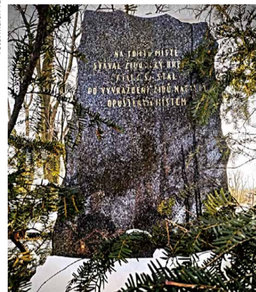
Bývalý židovský hřbitov za městským hřbitovem