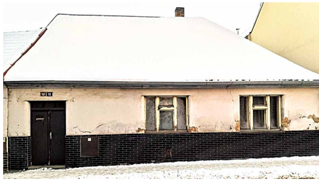
Dům č. p. 161 v Poděbradově ulici sloužil v 2. polovině 19. století jako židovská modlitebna

Počátky židovského osídlení v Lysé nad Labem lze doložit teprve od poloviny 16. století. V této době dochází k prvním cíleným pokusům státu o represii Židů a jejich vytlačování z velkých měst na venkov. I v relativně tolerantním 16. století stáli Židé mimo společnost. Nesměli vlastnit nemovitý majetek, živili se především obchodem a finančními službami, případně specifickými řemesly. Centrem židovského osídlení v Lysé byla až do poloviny 19. století panská vinopalna. Tu si židovské rodiny pronajímaly od vrchnosti a z ovocných a vinných zbytků v ní pájily kořalku.